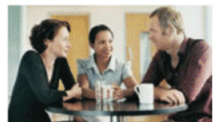
Não fique o tempo todo parado

E os cientistas confirmam! Quem tem histórico familiar de diabetes, há mais um incentivo: pausas de 5 minutos a cada meia hora de trabalho ajuda a prevenir o tipo 2 da doença mais do que a prática regular de atividade física isolada. Então, que tal dar uma levantada responsável depois de ler essas dicas?