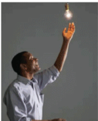
Posicione sua luz