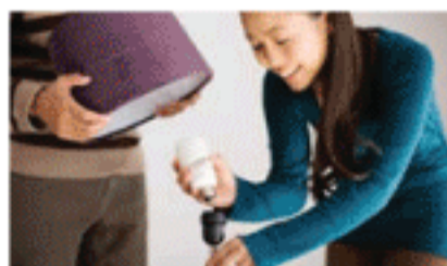
Olho vivo no tipo de lâmpada