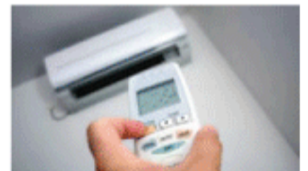
Condicione seu ar ambiente