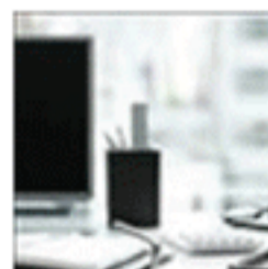
Cuidado com a janela