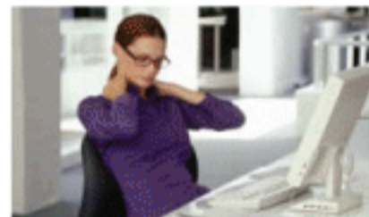
Cadeira a postos