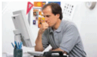
Ajuste a tela do computador