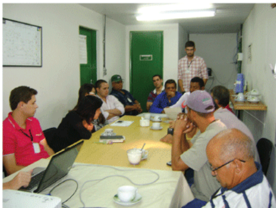
Posse dos membros da Cipa - Gestão 2013/2014