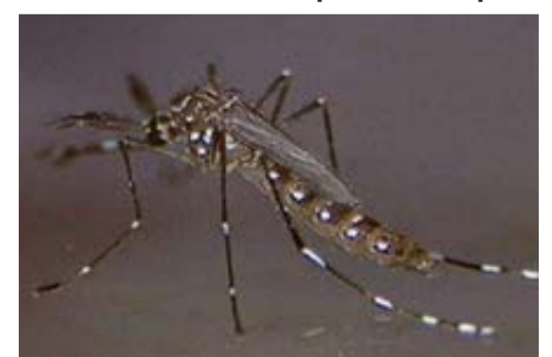
Imagem aumentada aproximada com um equipamento especial.

Agindo uma vez por semana, impedimos que os ovos se transformem em mosquitos, que têm em média o tamanho de um grão de arroz.