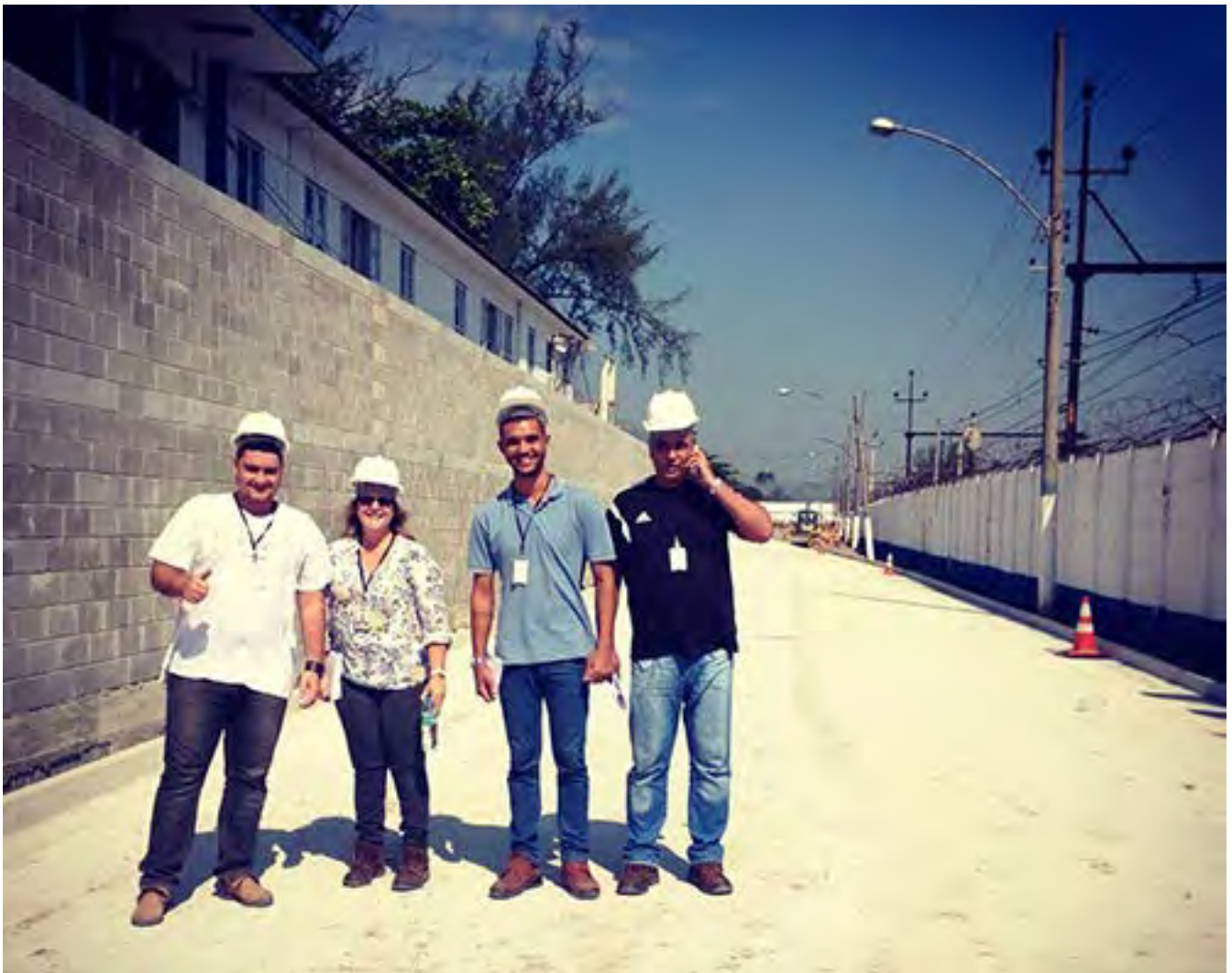
A equipe da auditoria interna esteve presente na obra 181 - Deodoro.