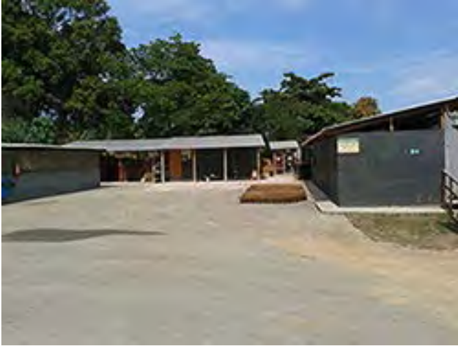
Verificação do canteiro da obra 180 - Saquarema.

A equipe de auditores esteve nas obras realizando auditoria no processo operacional.