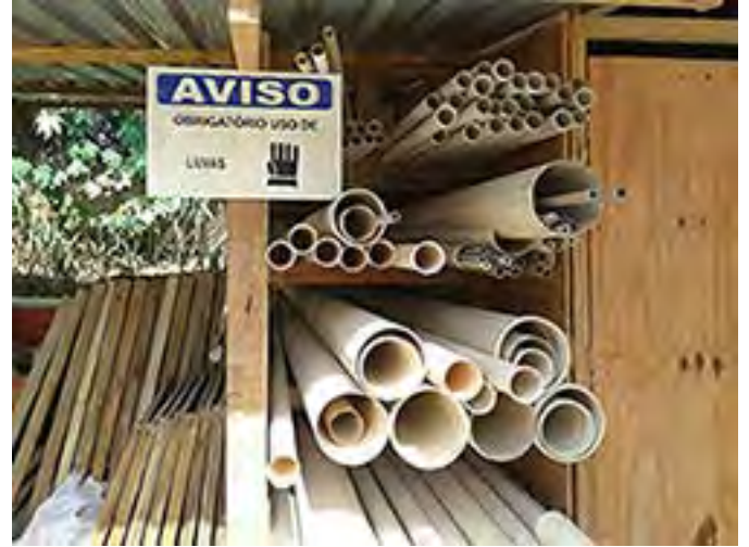
Verificação da organização dos materiais da obra 180 - Saquarema.